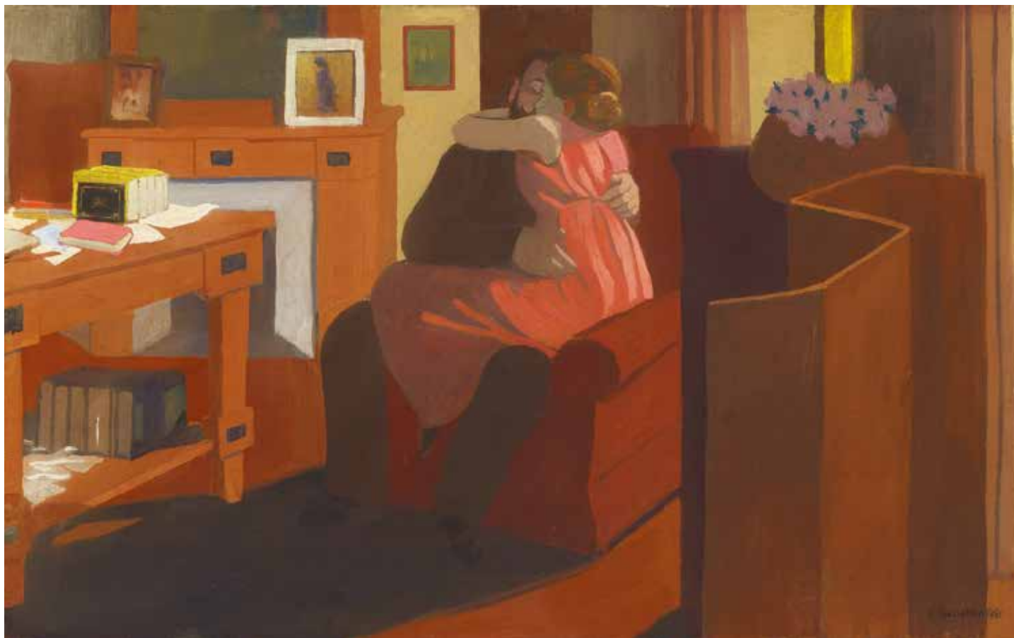
Cinq heures , 1898 Détrempe sur carton, 35,6x58,2cm Collection particulière